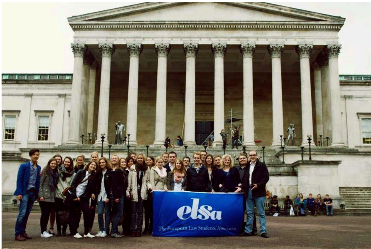
ELSA Bergen, ELSA Köln og ELSA Graz på joint Study Visit til London