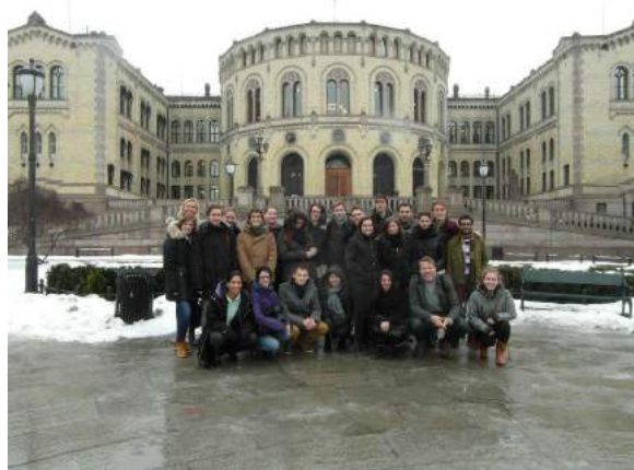
ELSA Oslo på tur til stortinget med utvekslingsstudentene

utvekslingsstudentene blitt fulgt opp gjennom deres semester i Norge gjennom forskjellige aktiviteter. Utenom mange uformelle sosiale sammenkomster har vi blant annet organisert to hytteturer, omvisning på Stortinget og i Høyesterett, 17. frokost og omvisning på Nobels Fredssenter. Alle våre aktiviteter er åpne for nasjonale så vel som internasjonale studenter, slik at aktiviteter som nevnt over ofte blir en møteplass mellom disse to studentgruppene.