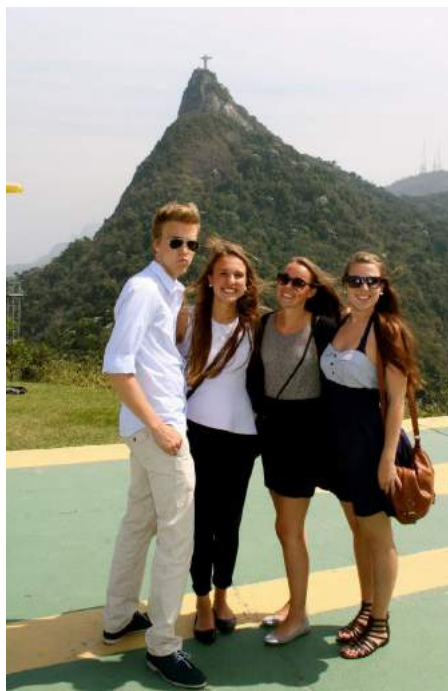
En gruppe jusstudenter fra ELSA Bergen på studietur til Brasil. Her foran kristusstatuen i Rio de Janeiro.

innsikt, men samtidig kunne oppleve destinasjonens kultur og sosiale liv. Det er erfaringsmessig veldig stor interesse både for å delta på turen, men også for å være med i gruppen som planlegger turen. Den store studieturen er også en viktig rekrutteringsarena for ELSA Bergen, ettersom mange av de som er deltakere på turen velger å bli med videre som aktive medlemmer i organisasjonen.