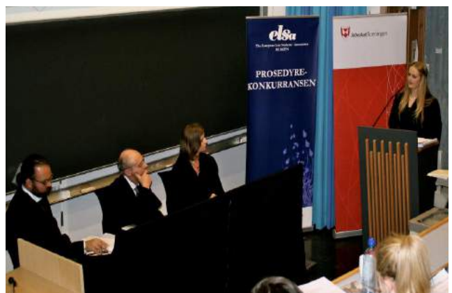
Den lokale prosedyrekonkurransen i Bergen.

Nytt av året er også ”Juss i praksis”, en foredragsrekke i samarbeid med Juristforeningen og Juridisk Studentutvalg, hvor det har blitt arrangert faglig relevante foredrag med et praktisk fokus, eksempelvis foredrag om inngåelse av leie- og samboerkontrakter. I likhet med resten av nettverket arrangerte også ELSA Bergen et arrangement på ELSA-Day. ELSA Bergens bidrag var en menneskerettighetskveld på Hulen i Bergen med debatt om aktiv dødshjelp etterfulgt av quiz.