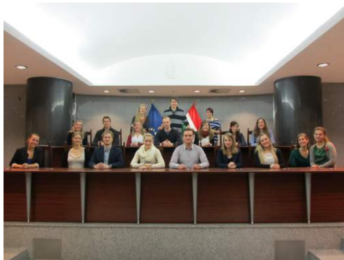
ELSA Bergen på besøk i Ungarns Høyesterett.

ELSA Bergen har også i år hatt fokus på studieturer og study visits. Den store studieturen, planlagt av det forrige styret, ble avholdt i august og gikk til Brasil med helserett som tema. Den neste store studieturen går av stabelen høsten 2013, hvor reisemålet er Cuba. I november deltok ELSA Bergen på en study visit i Budapest sammen med ELSA Köln, ELSA Graz og ELSA Düsseldorf. I likhet med fjoråret arrangeres også i år en study visit til London hvor ELSA Bergen vil være representert. Det internasjonale aspektet ved ELSA vises også ved at ELSA Bergen arrangerer en rekke aktiviteter for de internasjonale jusstudentene som er på utveksling i Bergen.