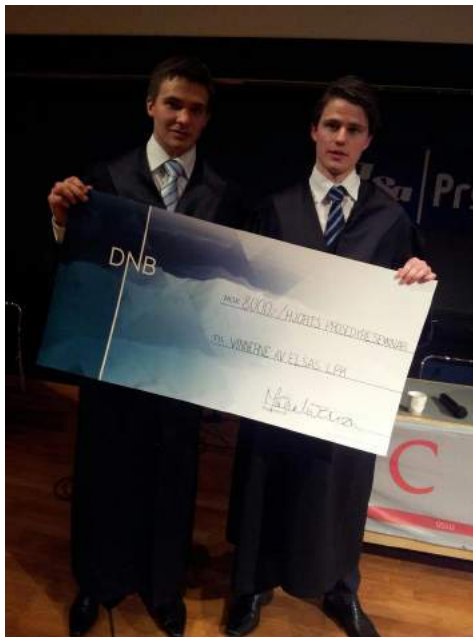
Vinnerlaget i den lokale prosedyrekonkurransen i Tromsø.

spennende premier. ELSA Tromsø har i år inngått enn langsiktig avtale med advokatfirmaet Hjort DA. Hjort DA er per i dag hovedsponsor for arrangementet og bidrar med premie til vinnerlaget. Denne avtalen har fungert veldig godt tidligere år, og vinnerlagene gir uttrykk for at Hjort DA leverer gode premier.