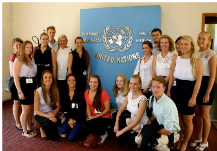
Studieturgruppen på besøk hos FNs informasjonssenter i Rio de Janeiro.

ELSA Bergens store studieturer har gått til mange spennende destinasjoner opp gjennom årene, blant annet Sør-Afrika og India. I august 2012 gikk den store studieturen til Rio de Janeiro i Brasil, og hadde helserett som tema. Planleggingen av denne turen ble gjort under forrige styreperiode. I tillegg til besøk hos brasilianske advokatfirmaer fikk deltakerne oppleve en av byens mange favelaer. I favelaen ble deltakerne guidet av representanter fra den frivillige organisasjonen Viva Rio, som driver undersøkende feltarbeid om blant annet helse, utdanning og sikkerhet. Det ble også arrangert en tur til FNs informasjonssenter, som blant annet har oversikt over den humanitære situasjonen i landet. Gjennom besøkene hos FNs informasjonssenter, private advokatkontorer, favelaen og organisasjonen Viva Rio, fikk deltakerne innsikt i det brasilianske helsesystemet og noen av de utfordringer det brasilianske samfunnet står overfor.