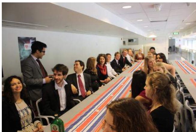
17. Maifrokost med utvekslingsstudentene.