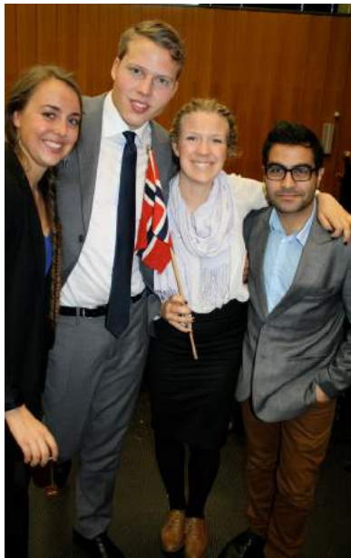
Deler av ELSA Norges delegasjon på ICM I Cologne